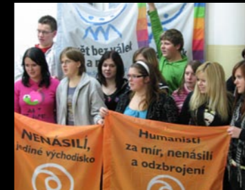
> Světový pochod za mír a nenásilí podpořili mezi jinými i studenti Hotelové školy Třebíč.