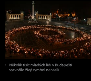
> Několik tisíc mladých lidí v Budapešti vytvořilo živý symbol nenásilí.