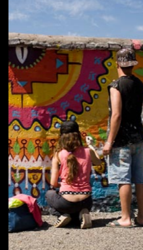
> Dvoul kilometrové Mírové graffiti v Chile se zapsalo do knihy rekordů.

< Více než 7 000 lidí na Mirparty na Václaváku v rámci Světového pochodu. Na podporu míru a nenásilí vystoupili mimo jiné také finalisté SuperStar nebo Harlem Gospel Choir.