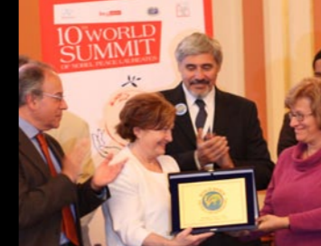
> Držitelka Nobelovy ceny míru Máiread Corrigan-Maguire vítá delegaci Světového pochodu na konferenci držitelů NC v Berlíně.