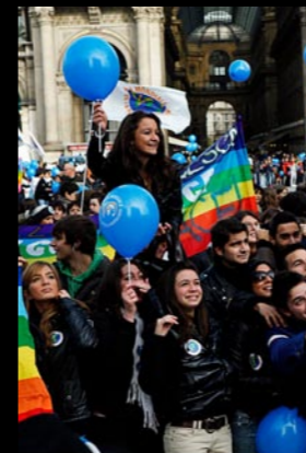
> Světový pochod v italském Miláně.